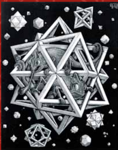
Estrellas, 1948. Xilografía Stars. Xylography

Producido por el Parque de las Ciencias de Granada en colaboración con el Patronato de la Alhambra y Generalife y financiado por la Fundación Española para la Ciencia y la Tecnología (FECYT), Ministerio de Economía y Competitividad