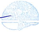
Ernesto Páramo Sureda

Y sin más asuntos que tratar, finalizó la reunión siendo las 10:45 horas del día señalado en el encabezamiento.